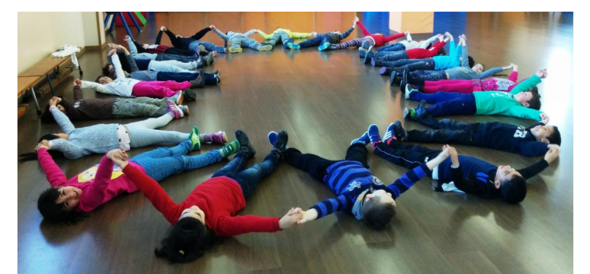
Escola Bàrkeno en un taller de dansa curs 2015-2016