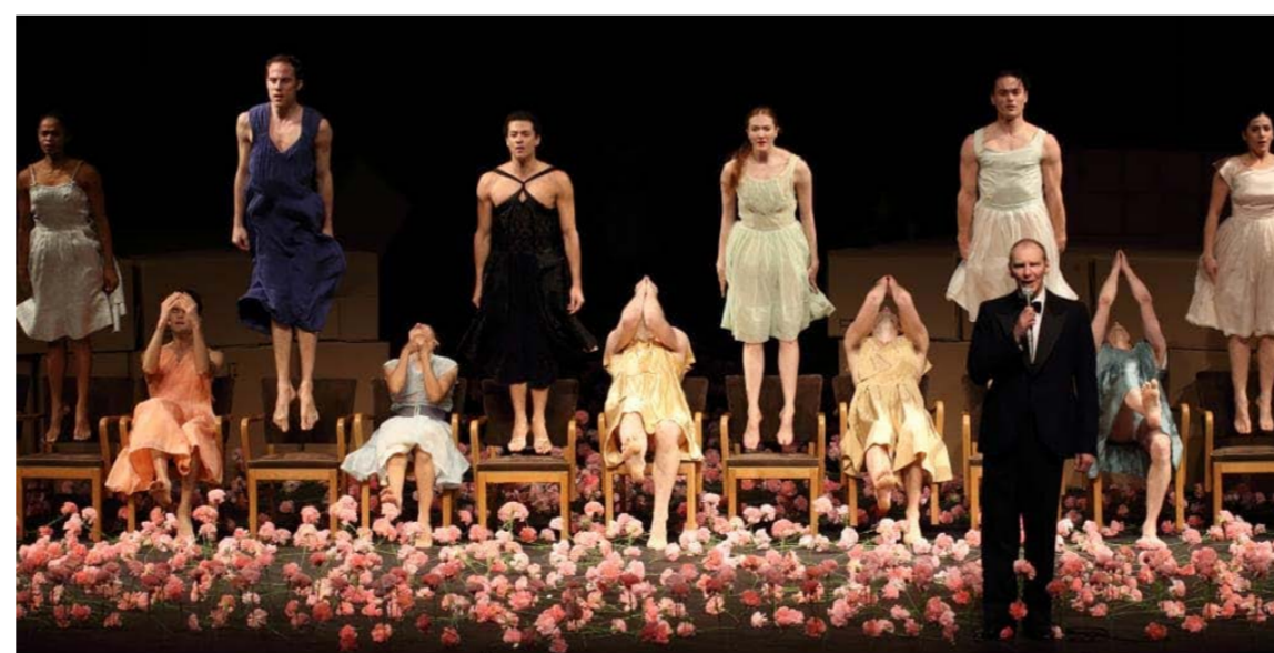
Adelaide Festival: Nelken by Tanztheater Wuppertal Pina Bausch. Tony Lewis. 2016